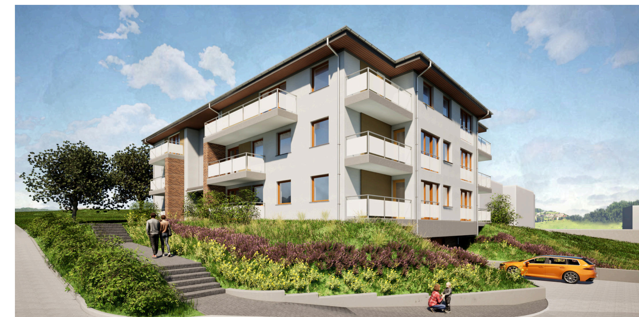
Jasień, ul. Nowy Świat